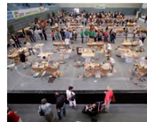
Die Sporthalle in Hard wurde zur Werkstatt für die Lehrlinge