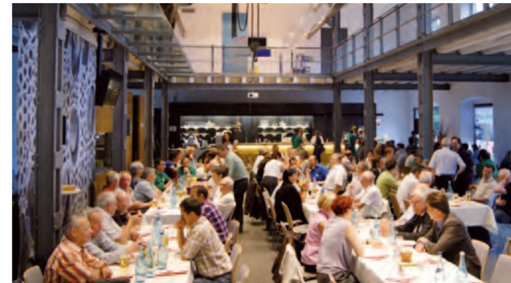
Die INATURA war gut besucht

Die diesjährige Generalversammlung stand ganz im Zeichen des Geschäftsführerwechsels. Dieser Umstand war sicher mit ein Grund für das rege Interesse an der Veranstaltung. Mit 140 Mitgliedern und Gästen durften wir in der INATURA in Dornbirn so viele Teilnehmer wie noch nie begrüßen.