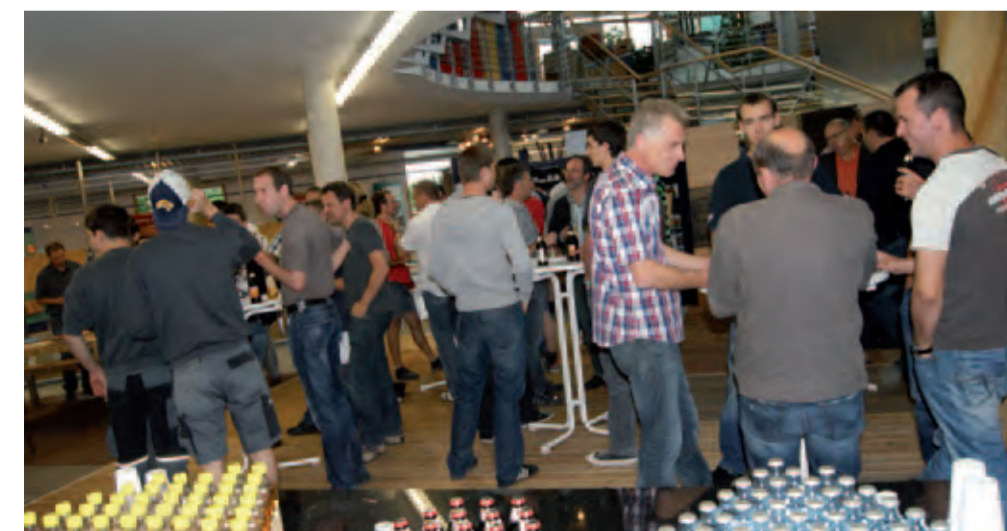
Im Anschluss an die Schulung wurden die neuen Furniere diskutiert.

Wir haben für Sie Musterbündel der neuen Furniere zusammengestellt. Diese beinhalten Muster unsers Lagerprogramms und eignen sich ideal, um sich selbst mit der Verarbeitungsweise vertraut zu machen sowie als Muster für Kunden. Sprechen Sie unseren Außendienst darauf an!