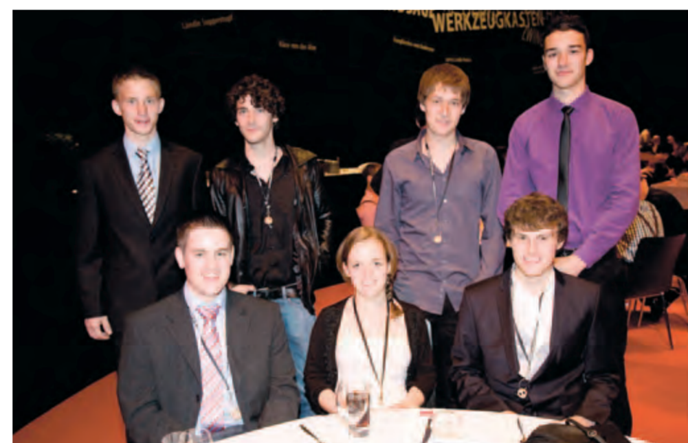
Das erfolgreiche Team aus Vorarlberg