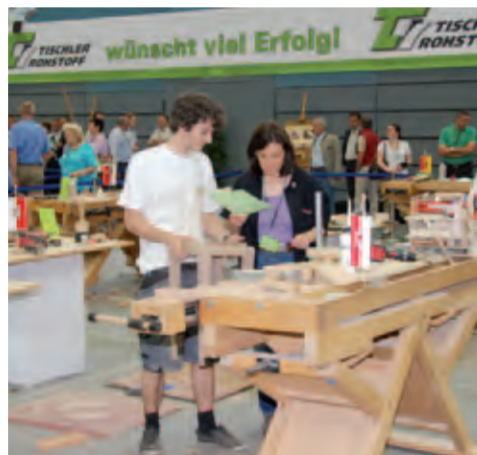
Der erhoffte Erfolg der Lehrlinge aus Vorarlberg blieb nicht aus

das Tischlerhandwerk in Vorarlberg in der nächsten Generation stehen wird. Aus diesem Grund unterstützt Tischler Rohstoff seit vielen Jahren die heimischen Lehrlinge, unter anderem auch bei den Landes- und Bundeswettbewerben. Bei diesen Wettbewerben können die Kandidaten nicht nur mit fachlicher Kompetenz punkten, sondern müssen auch ihre mentale Stärke und großes Geschick unter Beweis stellen.