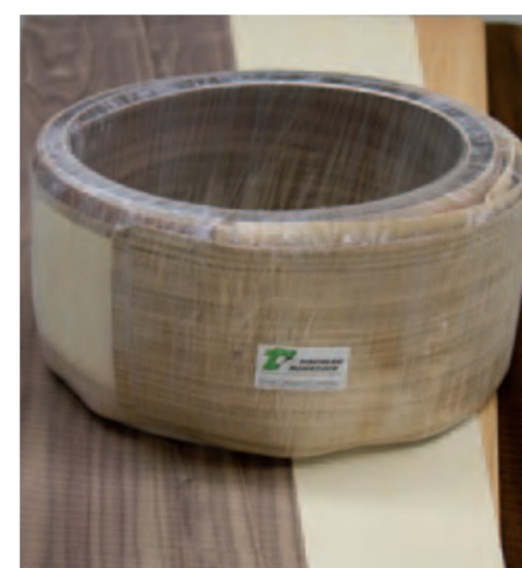
Die Rough und Wave Furniere besitzen spezielle dreidimensionale Oberflächen

der Zweidimensionalität von traditionellen Furnieren wurde diesen nämlich durch die sägeraue oder durch Hobel-schlag bearbeitete Oberfläche eine dritte Dimension hinzugefügt, die bisher Massivholzern vorbehalten war. Natursäge-rau, mit Wellendesign oder Riegeloptik, damit sind der Kreativität und den Einsatzmöglichkeiten im Möbelbau keine Grenzen gesetzt.