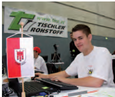
Tischlereitechniker bei der Arbeit

„Die Lehre schafft vielfältige Chancen für einen jungen Menschen. Einerseits durch Weiterbildung in der Branche bis zum Meister, andererseits durch Ablegung der Berufsreifeprüfung und der damit verbundenen Möglichkeit zu einem Studium. Bis es aber so weit ist, haben die jungen Menschen noch viele Schlüsselqualifikationen zu lernen. Diese Qualifikationen sind unter anderem die Bereitschaft sich weiter zu entwickeln und weiter zu bilden, Einsatzbereitschaft im Beruf, Flexibilität und eine gute Basisausbildung.“