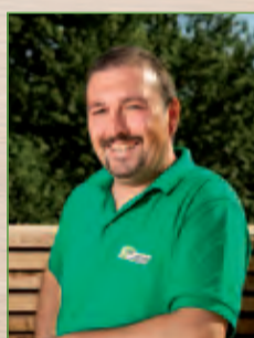
Udo Ceric Leiter Transport- logistik