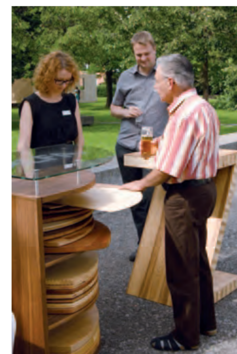
ALFA und Fundermax stellten ihre Produkte vor