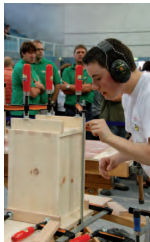
Jeder Handgriff wird von den Besuchern genau beobachtet