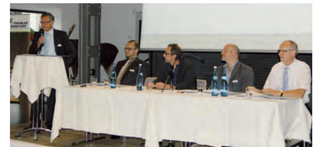
Dir. Mag. Riedmann konnte für das Jahr 2010 ein Rekordergebnis präsentieren